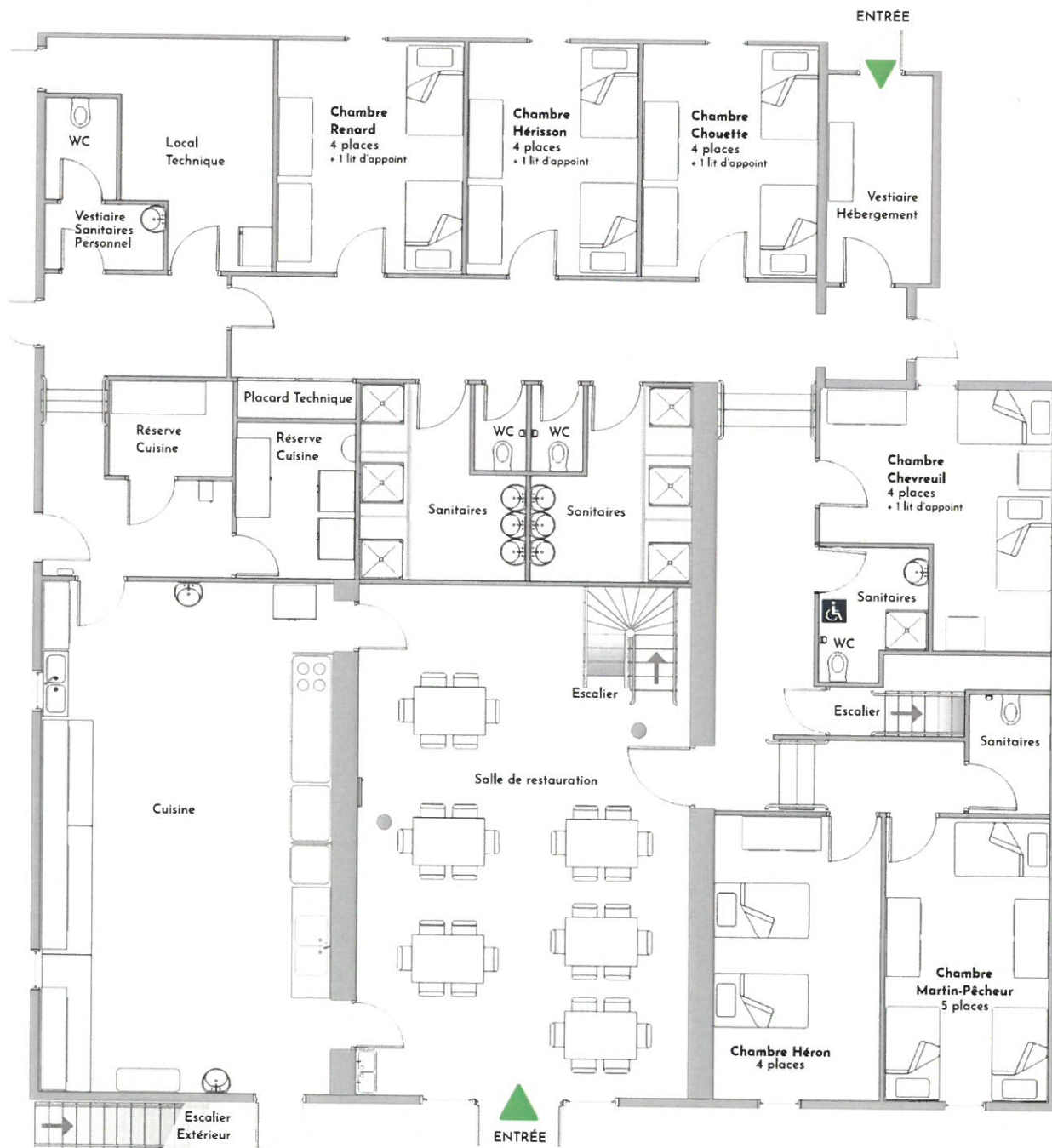
■ Rez de chaussée - 29 lits